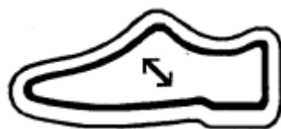
podšívka a stélka